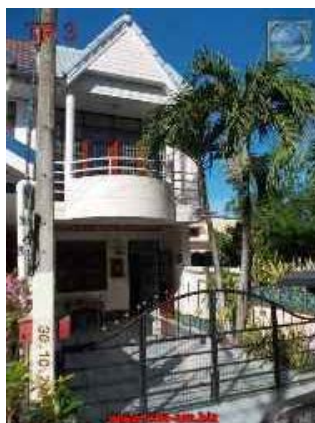
TP3 Sport Village